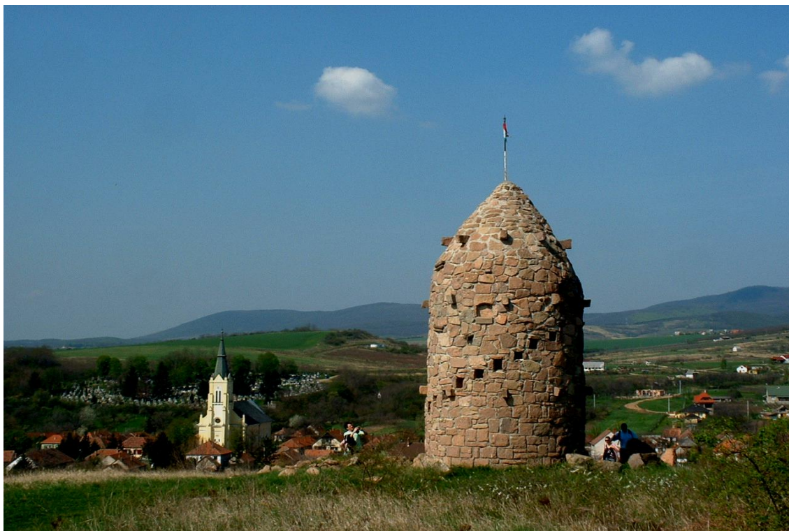
3. A kilátó, háttérben Cserépfalu