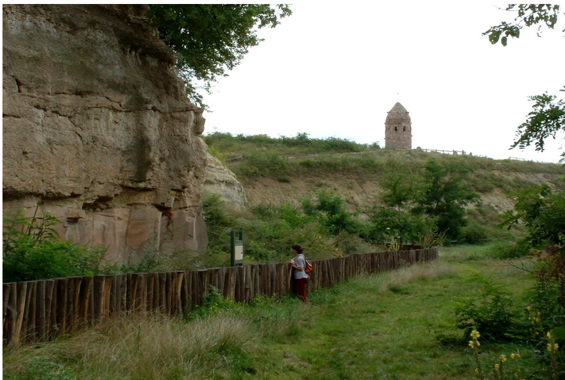
4. Az Ördögtorony tanösvényből egy részlet