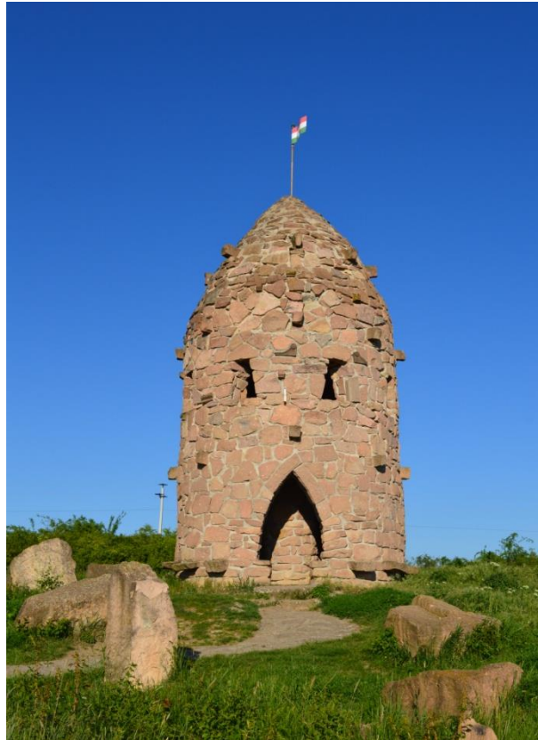
1. A kilátó