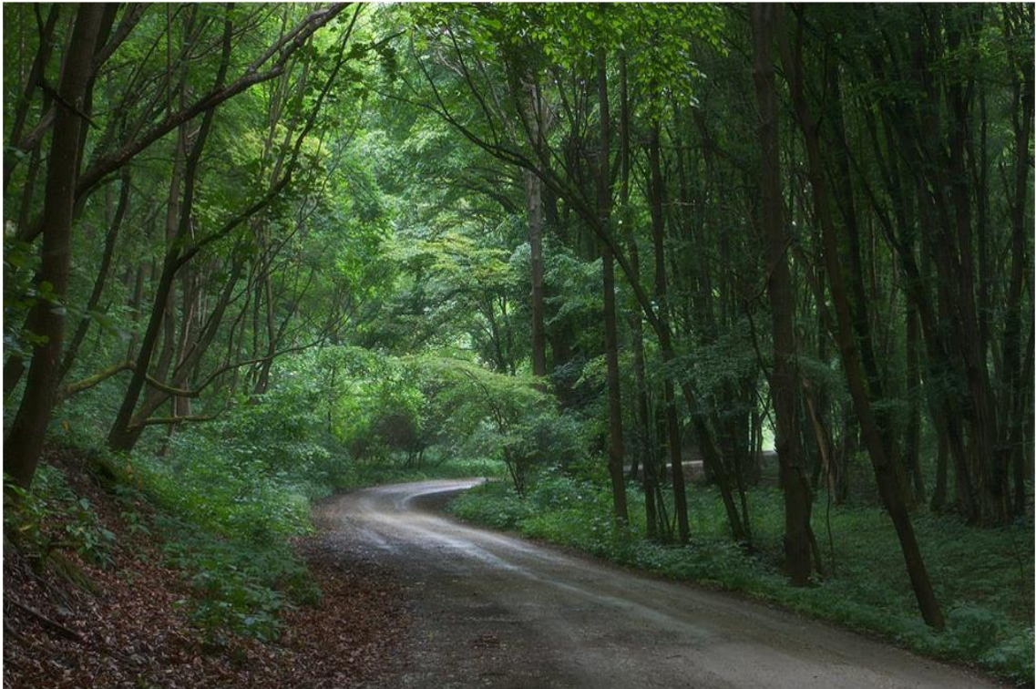
1. Hór – völgye zöldbe borulva