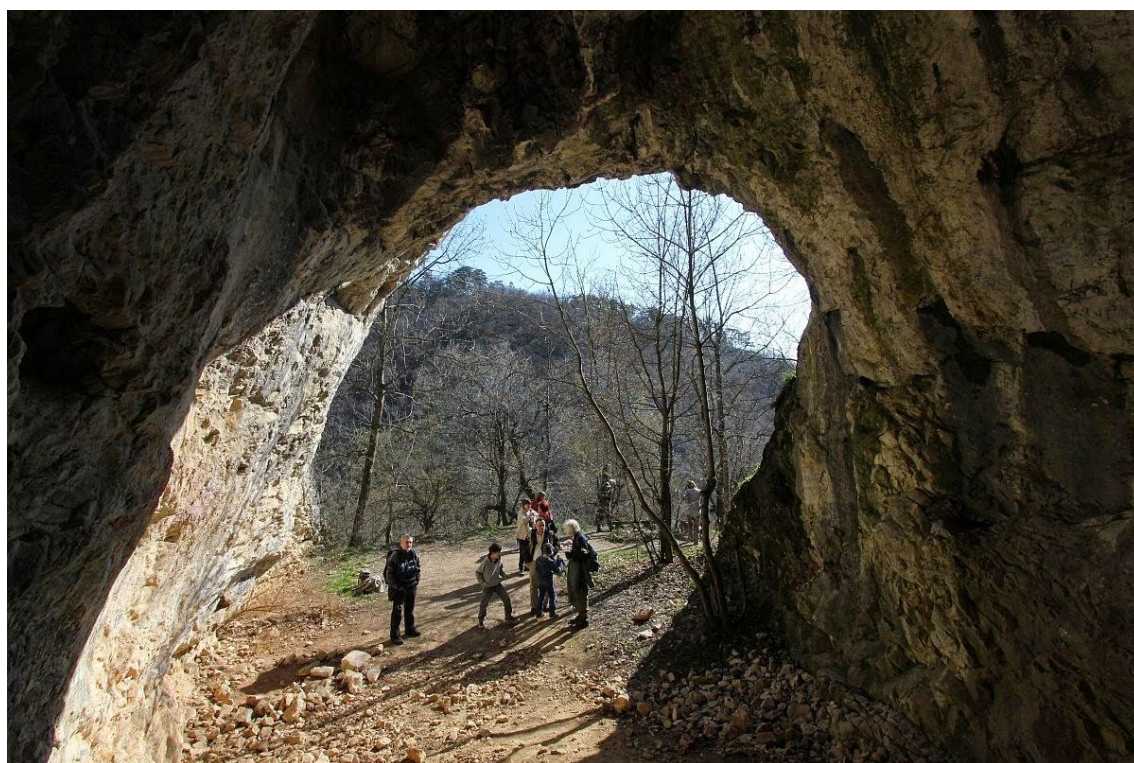
2. Túrázók a Suba-lyukban