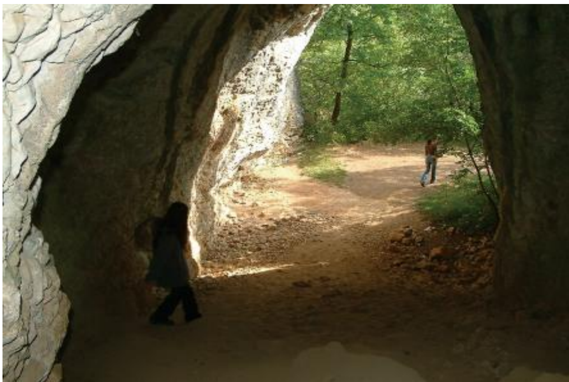
1. Túrázók a Suba-lyukban