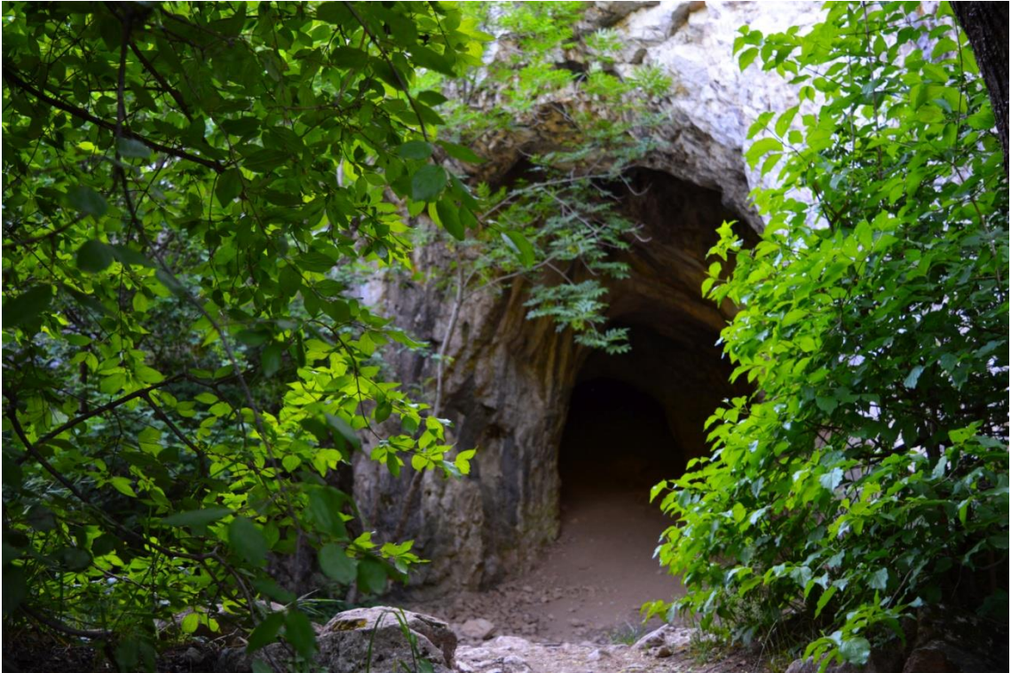
3. A Suba-lyuk barlang bejárata