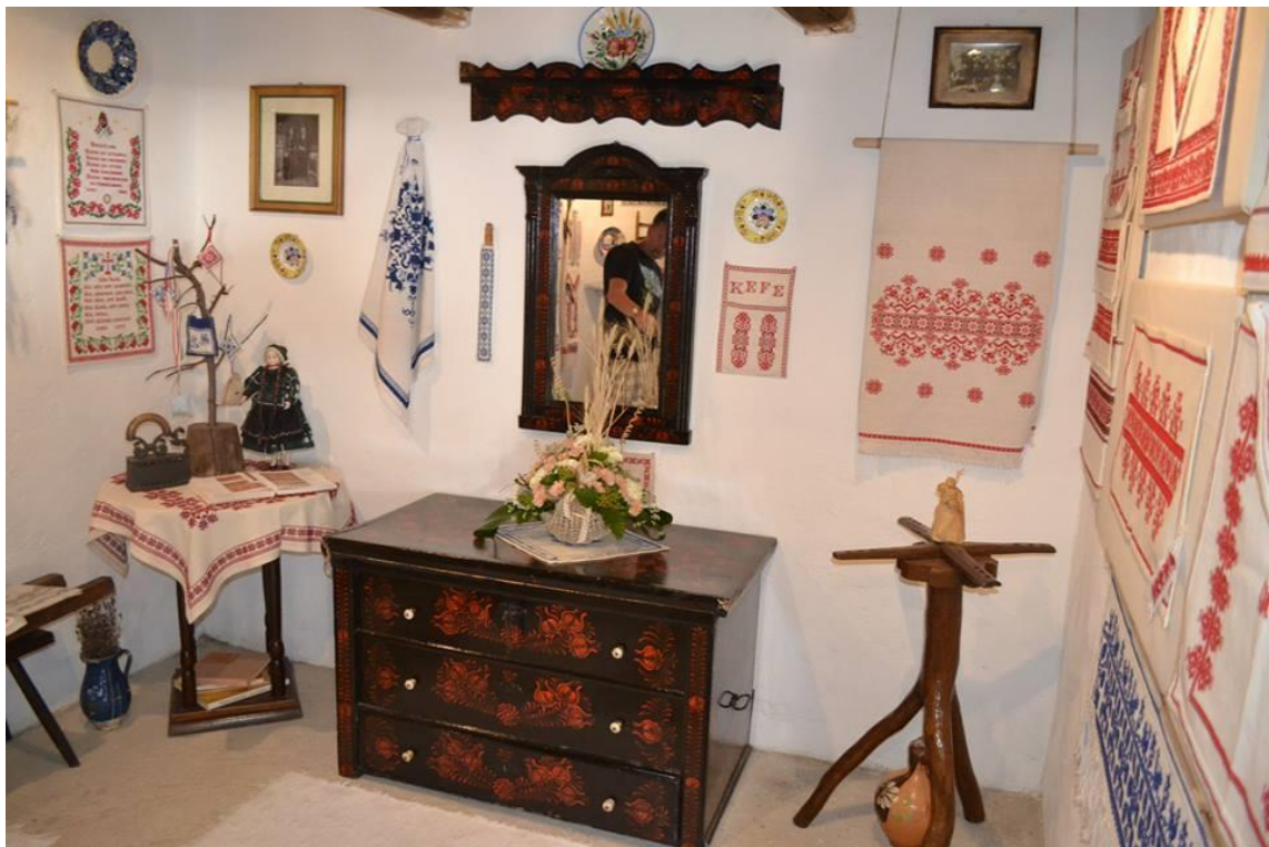
2. Malvinka néni munkái